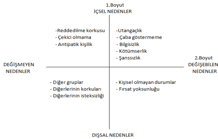
Şekil 1. Yalnızlığın algılanan on üç nedeni (Michela vd., 1982)

Yalnızlık çeşitli nedenlerden dolayı ortaya çıkabilmektedir. Michela vd. (1982), yalnızlığın değişebilen, değişmeyen, içsel ve dışsal nedenler olarak dört farklı kategoride ele alarak yalnızlığın on üç nedeni olduğunu belirtmişlerdir. Yalnızlığın algılanan on üç nedeni Şekil 1' de sunulmuştur.