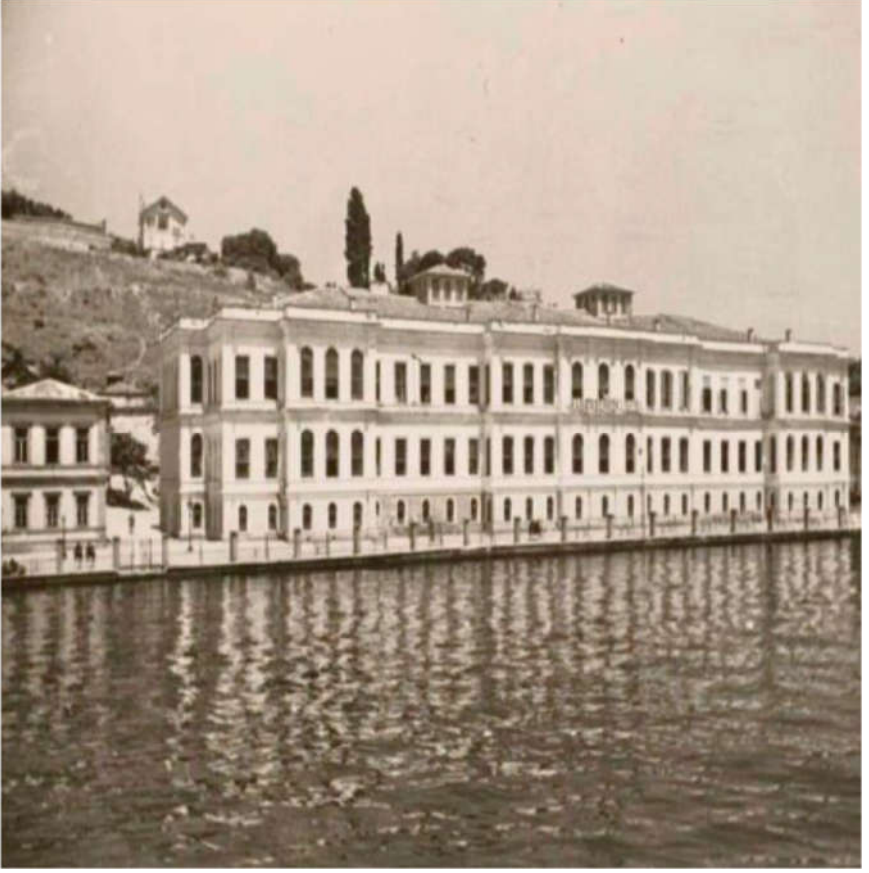
Resim 3: Aşiret Mektebi olarak kullanılan Esmâ Sultan Sarayı'nın görünümü