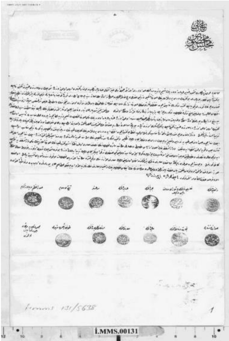
Belge 3: Aşiret Mektebi'nin açılması ve nizamnamesinin tanzimiyle tefrişat ve levazımının ikmalî.