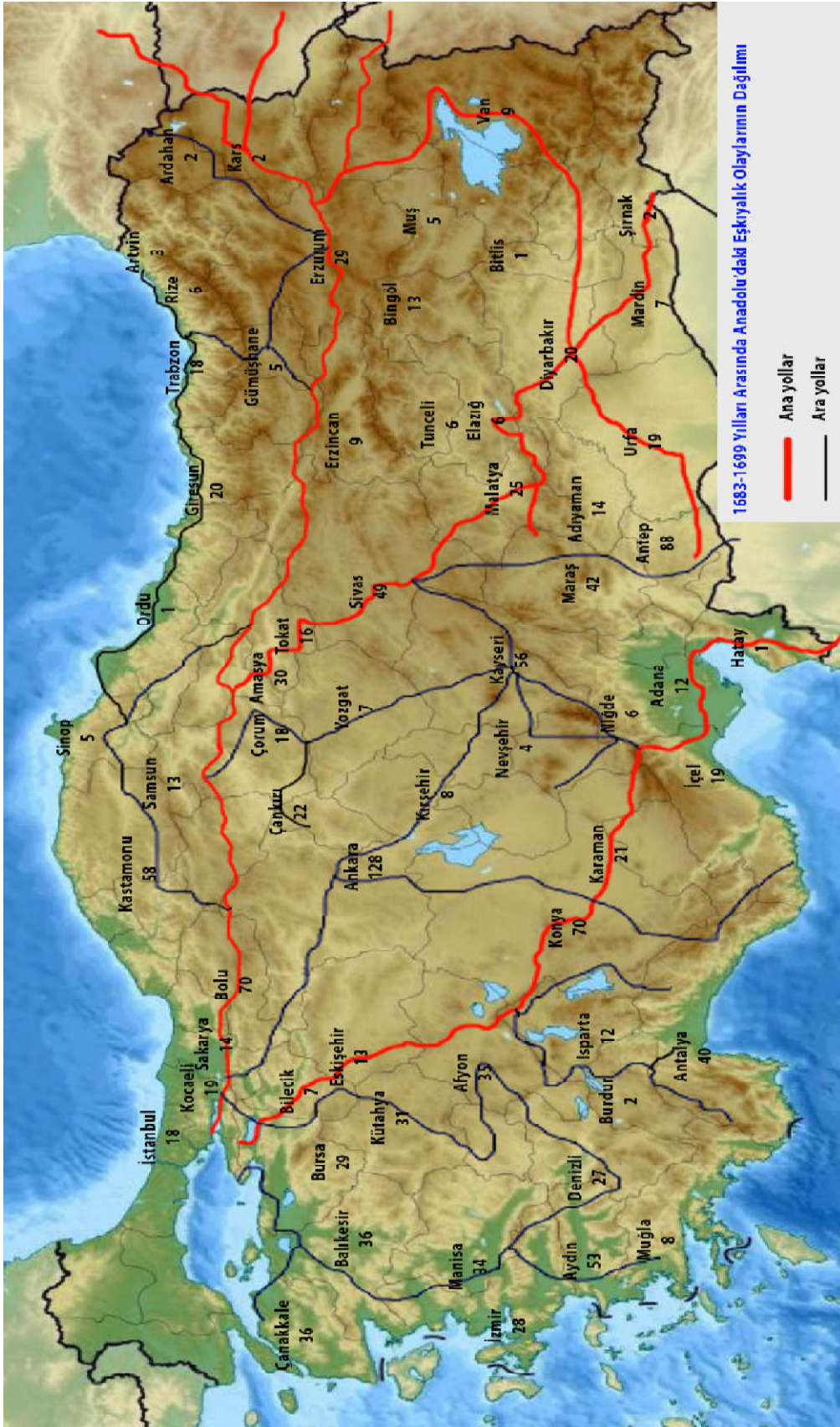
Ek-1. 1683-1699 Yılları Arasında Anadolu'daki Eşkıyalık Hareketlerinin Dağılımını Gösteren Harita.